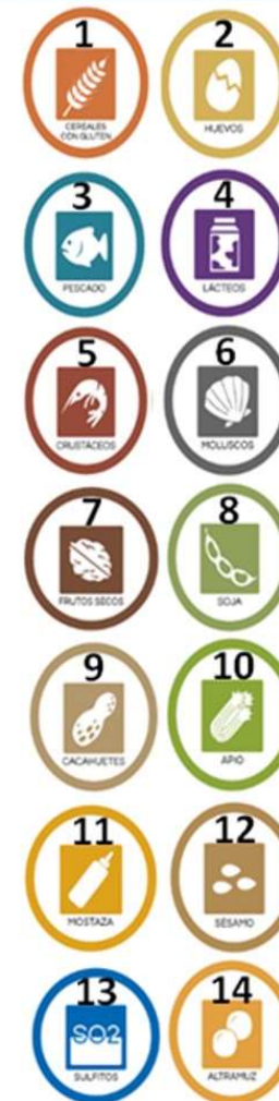
LEYENDA DE ALÉRGENOS